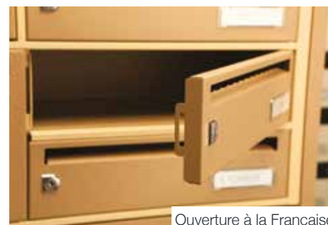
Ouverture à la Française